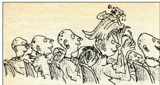
Tekeningen van Quinten Blake uit The Witches

Dit verneemt het 7-jarige hoofdpersonage van zijn grootmoeder in Noorwegen, waar hij opgroeide nadat zijn ouders in Groot-Brittannië bij een auto-ongeval om het leven kwamen. Hoe het verhaal precies eindigt geven we niet prijs, maar de jongen leeft nog en de heksen niet langer.